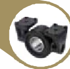
Подшипник диска рыхления почвы